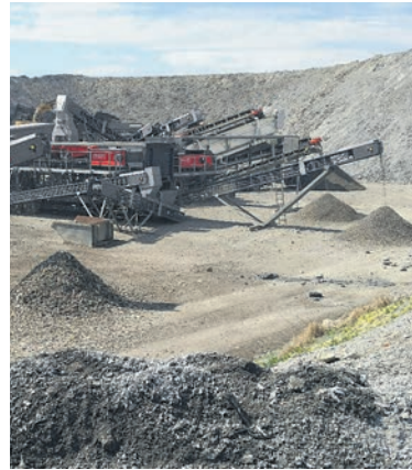
Un traitement spécifique des scories des déchets est nécessaire pour répondre aux attentes environnementales.

La synergie des activités a naturellement conduit les trois entités à créer une société commune, active sur toute la Suisse romande,